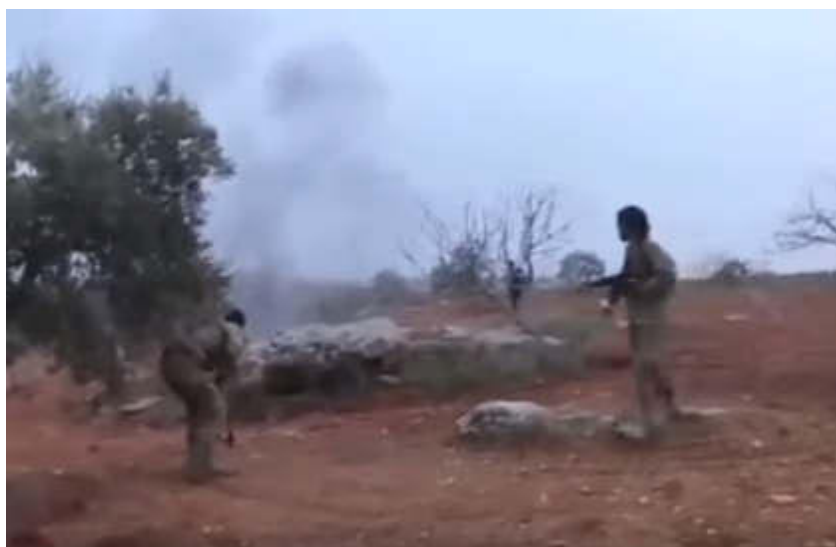
Последний бой он принял на земле!

на землю. Затем, снова поднявшись, крадучись стали приближаться к уже погибшему пилоту.