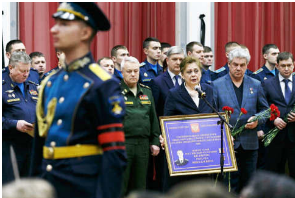
Прощание воронежцев с Героем

Для тысяч воронежцев этот февральский ненастный день стал самым печальным, наверное, со времен войны. Несмотря на ненастную погоду, тысячи горожан пришли проститься со своим земляком. Воронеж, город воинской славы, погрузился в скорбь, вместе с ним переживали эту боль миллионы россиян от Приморья до Калининграда.